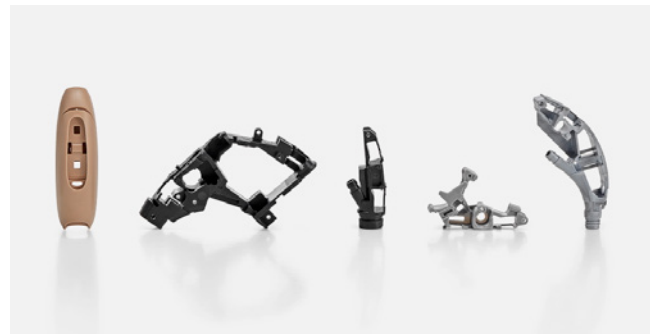
Hochkomplexe Spritzgiessteile für Hörgeräte